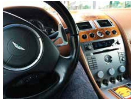
12.00 Uhr Mindestens dreimal pro Woche fahre ich von Hamburg nach Weissenhaus, die Strecke lege ich mit meinem Aston Martin in einer guten Stunde zurück.