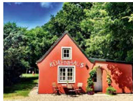
17.00 Uhr Ich schaue im „Kükenhaus“ vorbei, wo die Kinderbetreuung stattfindet. Wir erweitern gerade den Außenspielplatz nach vorn, Details werden abgestimmt.