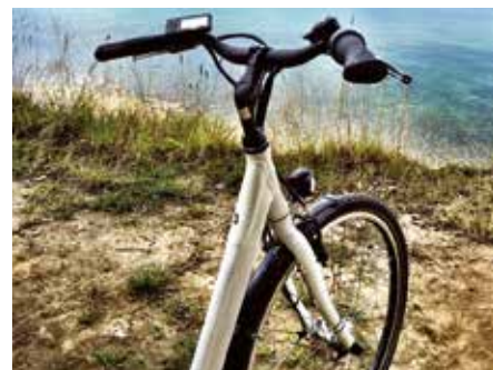
16.00 Uhr Kleine Pause: Ich steige aufs Rad, fahre verschiedene „Baustellen“ auf dem Gelände ab und genieße gleichzeitig die Natur sowie den Blick aufs Meer.