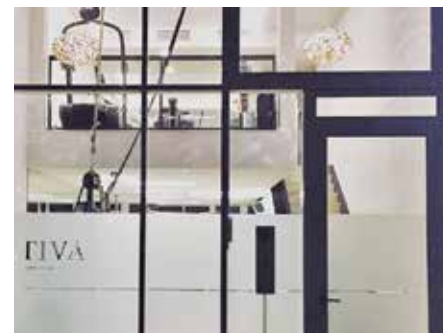
21.00 Uhr Nach einem Snack im Bootshaus fahre ich zurück nach Hamburg und direkt zum Training bei „Tativa“ – eine halbe Stunde Sport am Tag muss sein.