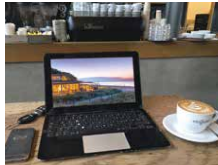
8.00 Uhr Mein erster Arbeitsplatz des Tages: das „Elbgold“ im Schanzenviertel. Für den perfekten Cappuccino habe ich in jeder Stadt ein Lieblingscafé.