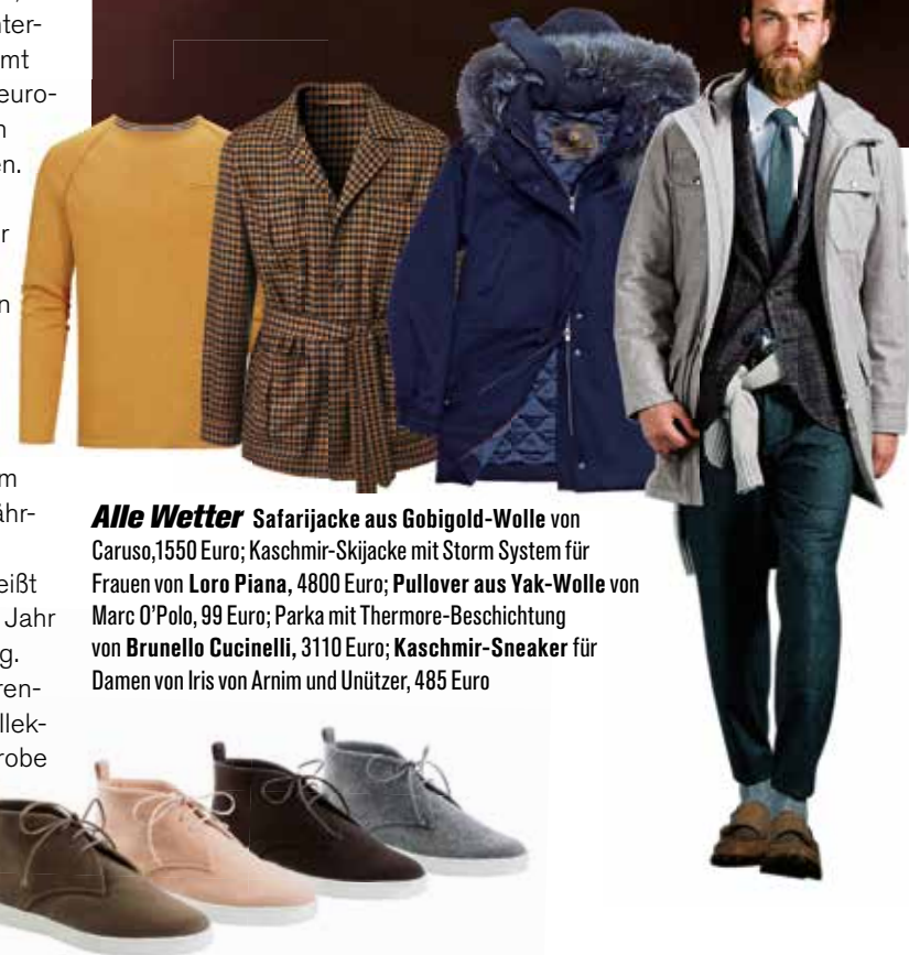
Alle Wetter Safarijacke aus Gobigold-Wolle von Caruso, 1550 Euro; Kaschmir-Skijacke mit Storm System für Frauen von Loro Piana, 4800 Euro; Pullover aus Yak-Wolle von Marc O'Polo, 99 Euro; Parka mit Thermore-Beschichtung von Brunello Cucinelli, 3110 Euro; Kaschmir-Sneaker für Damen von Iris von Arnim und Unützer, 485 Euro

schleppen ist da wenig verlockend. Deshalb arbeiten die Stoffspezialisten von Zegna am optimalen Gewebe für unterwegs. Die Linie Z Zegna bietet jetzt „Techmerino“: Schafwolle mit einem speziellen Finish, das den Stoff flexibel hält und die Wärme reguliert. So sieht der Anzug selbst nach einem Nachtflug aus wie frisch angezogen, und das Shirt trägt sich auch bei der Ankunft in den Subtropen angenehm kühl.