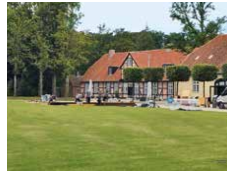
14.00 Uhr Bei uns finden oft Events statt, heute wird die Veranstaltung eines Autobauers vorbereitet, der das Resort exklusiv für zwei Wochen angemietet hat.