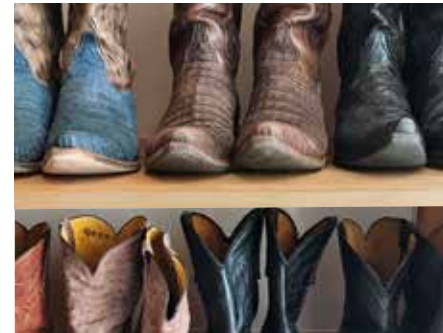
7.30 Uhr Seit knapp 20 Jahren trage ich praktisch nur Cowboy-Boots. Sie sind für mich am einfachsten anzuziehen und geben mir eine gute Körperhaltung.