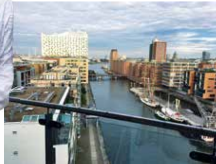
7.00 Uhr Zu dieser Zeit stehe ich normalerweise auf und betrachte das typische Wetter in Hamburg. Mein Ausblick auf die Hafencity: viel Beton und Backstein.